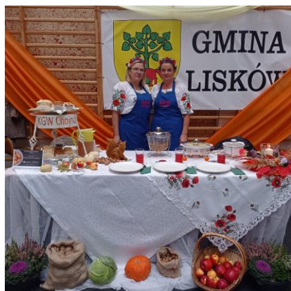
- Koło Gospodyń Wiejskich z miejscowości Chojno - „Prażok z kapustą zasmażaną”