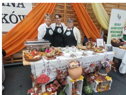
- Koło Gospodyń Wiejskich z miejscowości Pośrednik – „Pyrzoki z zupą dyniową”