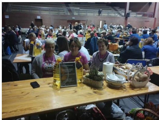
Święto pyry ma na celu kultywowanie regionalnych tradycji kulinarnych, uczczenie zbiorów oraz integrację społeczności Kół Gospodyń Wiejskich. (Anna Fedorczyk)