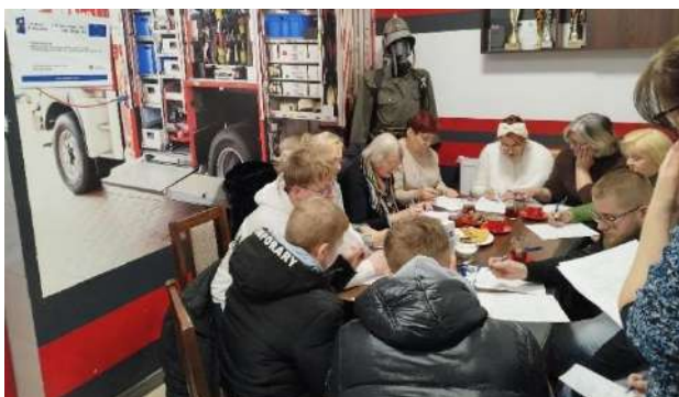
SPOTKANIE Z SOŁTYSAMI